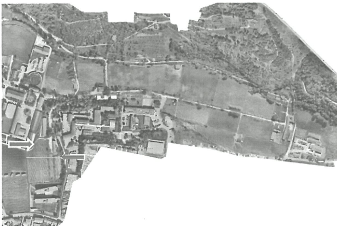
Figura 1 – Localização do “Espaço U” no campus da ESAC-IPC